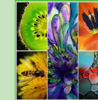
Curs Pintura UP

Del 31 de maig al 30 de juny CURS PINTURA UP Naturaleza y vida en macro Inauguració: Dimecres 31 de maig, 19 h