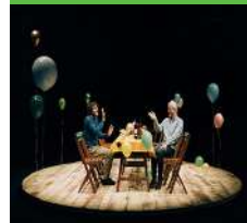
El Pont Flotant

Divendres 14 d'abril, 20:30 h Casa Municipal de Cultura C/ Progrés, 9. El Port de Sagunt COMEDYPLAN La comèdia de la vida: Comèdia En valencià. Tots els públics. Preu de l'entrada: 7 euros. Duració: 70 minuts