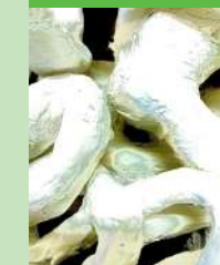
les Clot Del Moro

Del 4 de maig al 17 de juny IES CLOT DEL MORO L'Art e(ix) del Clot: Textures Inauguració: Dijous 4 de maig, 19 h