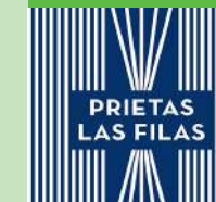
Museo Valencià d'Etnologia

Del 24 de març al 22 d'abril MUSEU VALENCIÀ D'ETNOLOGIA Prietas las filas Inauguració: Divendres 24 de març, 19 h