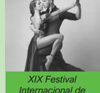
XIX Festival Internacional de Tango

Dissabte 29 d'abril, 20 h Centre Cultural Mario Monreal C/ Roma, 9. Sagunt XIX FESTIVAL INTERNACIONAL DE TANGO Buenos Aires Tango Cuarteto y Óscar de Urquiza Preu de l'entrada: 9 euros. Duració: 90 minuts