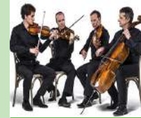
Quartet de Zagreb

Divendres 12 de maig, 20:30 h Casa Municipal de Cultura C/ Progrés, 9. El Port de Sagunt QUARTET DE ZAGREB Turina/ Beethoven /Dvorak: Música clàssica Preu de l'entrada: 7 euros Duració: 75 minuts