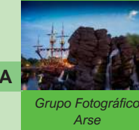
Grupo Fotográfico Arse

Del 5 al 28 d'abril GRUPO FOTOGRAFICO ARSE La vida es sueño Inauguració: Dimecres 5 d'abril, 19 h