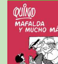
Mafalda y mucho más

Del 4 de maig al 30 de juny QUINO Mafalda y mucho más Inauguració: Dijous 4 de maig, 19 h