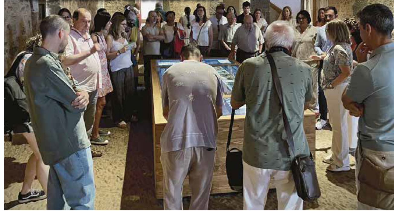
Varios instantes de la apertura al público del nuevo centro de interpretación ubicado en el Grau Vell de Sagunt.

▶ EL FORTÍN SE CONVIERTE EN UN CENTRO DE INTERPRETACIÓN QUE CUENTA MÁS DE 2.000 AÑOS DE LA HISTORIA PORTUARIA DE SAGUNT