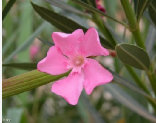
Detalle de la flor del baladre ( Nerium oleander ) José Antonio López Espinosa