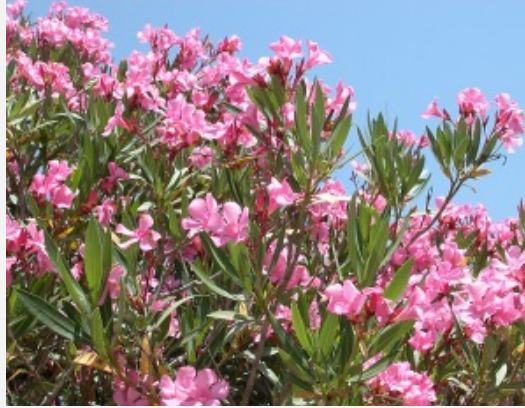
Baladre ( Nerium oleander ) en plena floración José Antonio López Espinosa