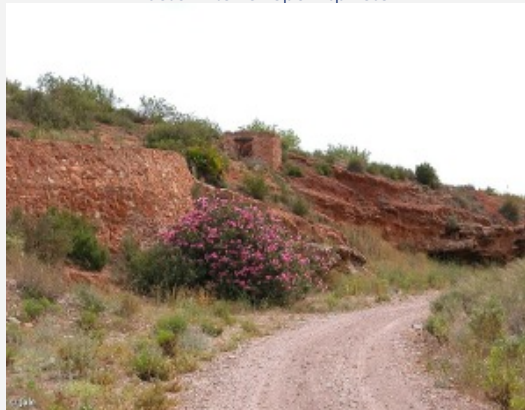
Baladre ( Nerium oleander ) creciendo aislado en el fondo de una rambla José Antonio López Espinosa