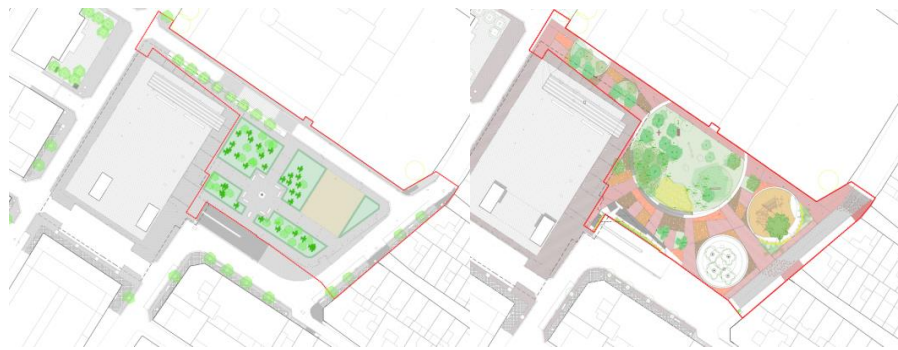
Estado actual de la Plaza del Sol

La tercera actuación, la más significativa y la que enlaza todas las demás, replantea los espacios de la zona oriental de la plaza del Sol. En primer lugar, prevé el traslado del monumento al trabajador de la plaza del Sol a la plaza 1º de mayo. Este hecho permite replantear y reforzar la identidad de la plaza del Sol, que toma su propio nombre y de las necesidades más urgentes expresadas por las usuarias de los espacios. En segundo lugar, se prevé la realización de una gran zona verde a modo de refugio climático (accesible a todos y facilitador de usos diversos); de un espacio de cruce y encuentro con bancadas y graderías; de un espacio de juego de niños y niñas; y de un espacio multiuso con elementos de mobiliario urbano configurables. Toda esta actuación, diseñada a partir de geometrías circulares (a modo de Soles), organiza los pavimentos de la plaza. El interior de los “círculos” son pavimentos permeables (parterres, areneros, terreno natural); y el exterior, las zonas de paso, son un mosaico de cerraduras de pavimento de adoquín rojo (el existente en todo el entorno urbano de la plaza y del mercado) y de pavimento terroso continuo natural.