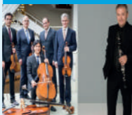
Quinteto Cuerda Filarmónica Berlín