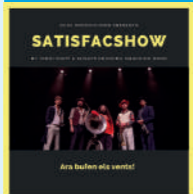
Always drinking machine band