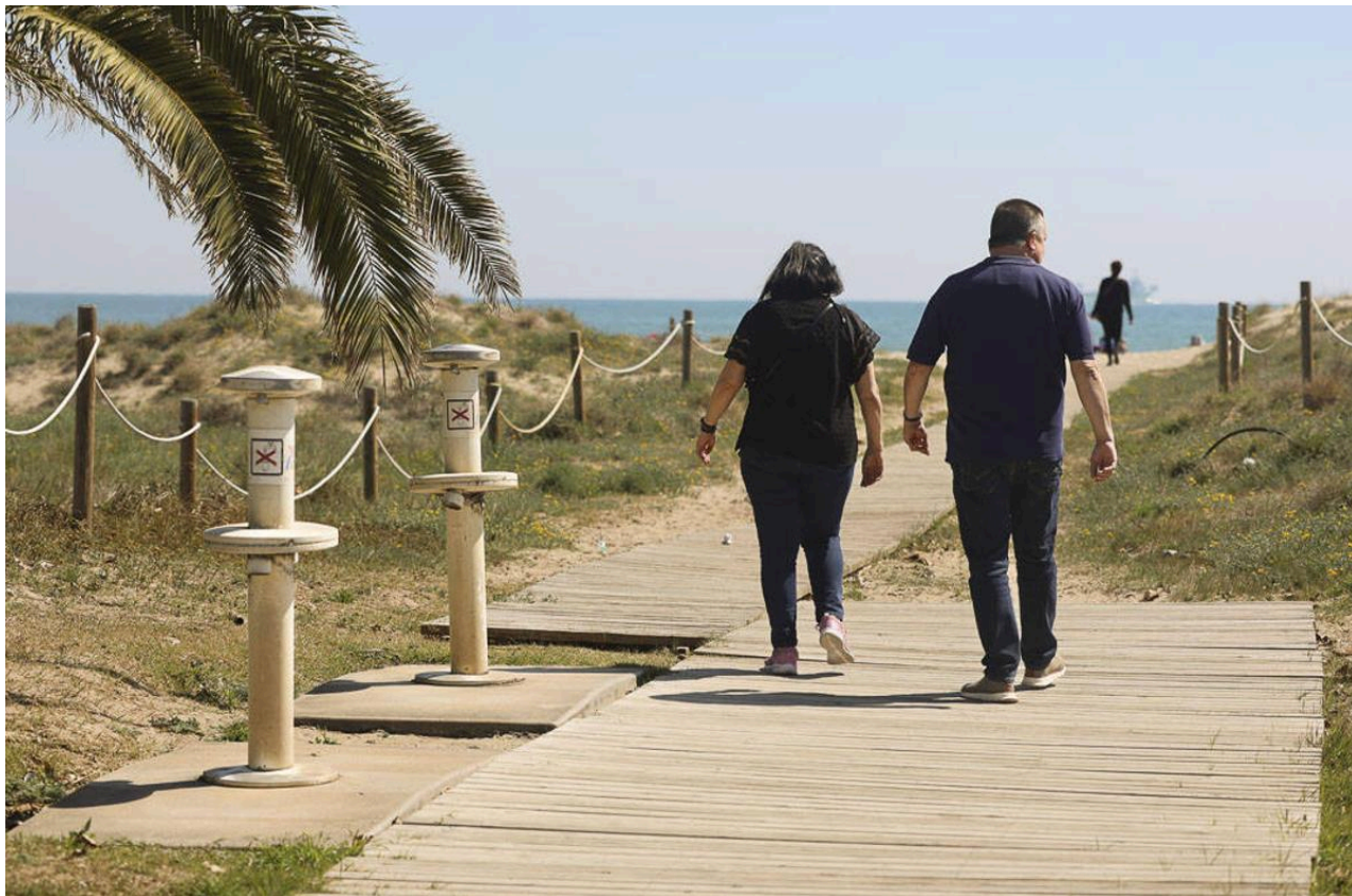
La playa del Port de Sagunt.

Por otro lado, el tercer bloque pone el foco en la gestión de residuos, especialmente en la recogida selectiva, la fracción orgánica y la implicación tanto de la ciudadanía como del sector turístico. Por último, el cuarto bloque trata la prevención de incendios, con protocolos de actuación y seguridad en zonas forestales y turísticas.