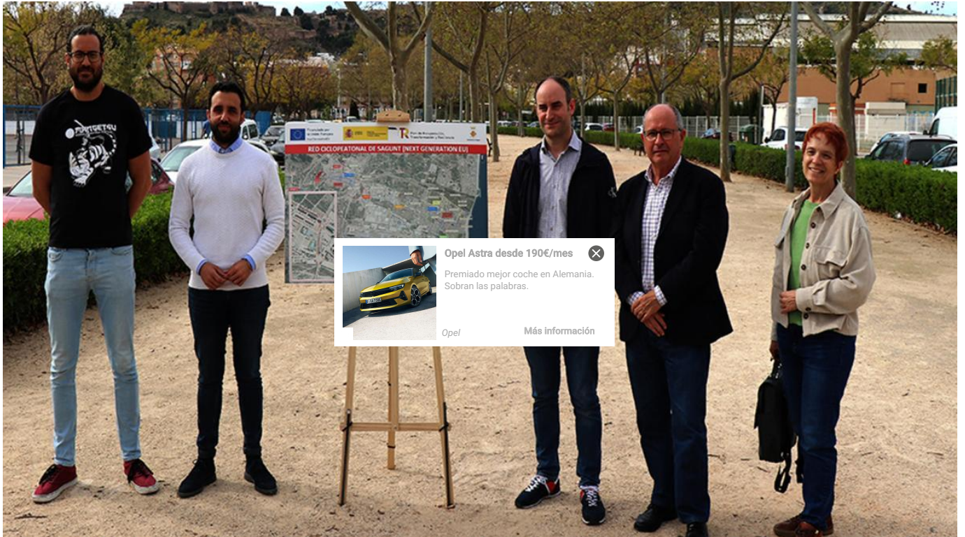
El alcalde y otros concejales del Ayuntamiento de Sagunt.