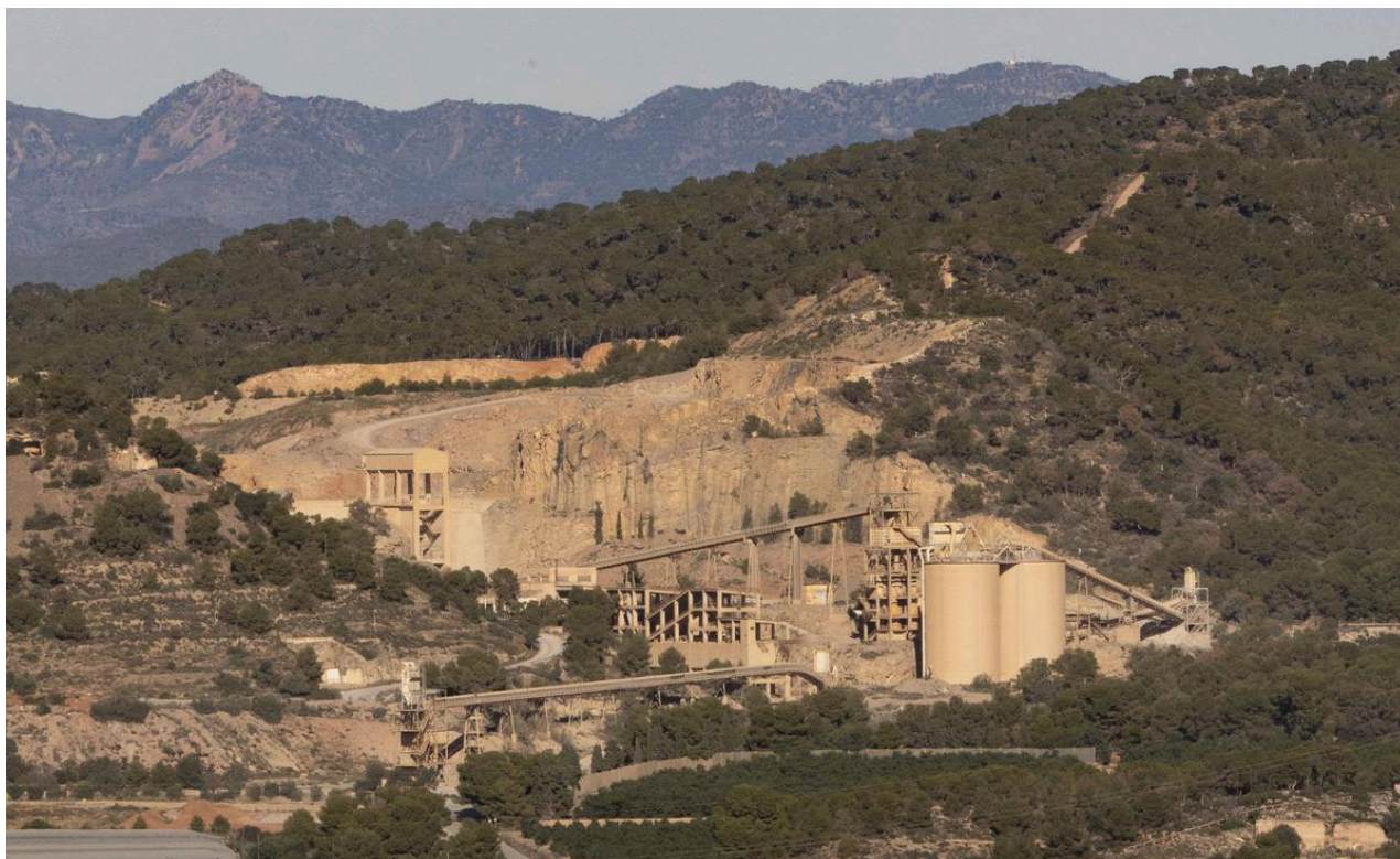
Montaña Romeu.